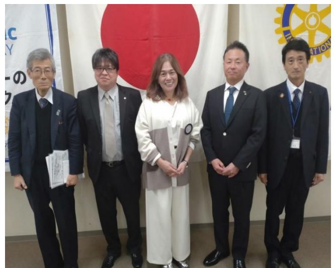
次年度(2025-26)理事・役員